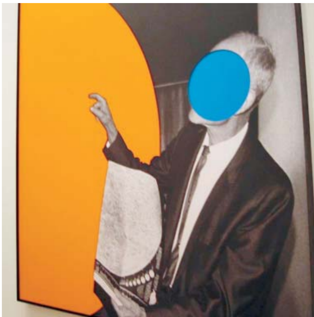
Novi radovi pionira konceptuale: John Baldessari u Deutches Guggenheimu

Na taj se način Deutches Bank povezala s prepoznatljivim imenom mecene suvremene umjetnosti, Solomonom Guggenheimom, spojivši se s ostalim slavnim Guggenheimovim umjetničkim projektima poput Guggenheimovim muzejom u New Yorku, venecijanskom Zbirkom Peggy Guggenheim, Guggenheimovim